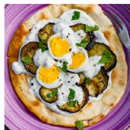
JEUDI Pitas végétariennes