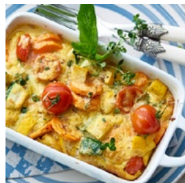
MERCREDI Frittata de légumes