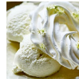
ASTUCE FLEURS DE SUREAU DE LA SEMAINE