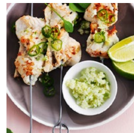
VENDREDI Brochettes de poisson