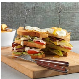
MARDI Club Sandwich