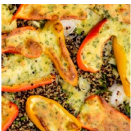
LUNDI Mini-poivrons farcis