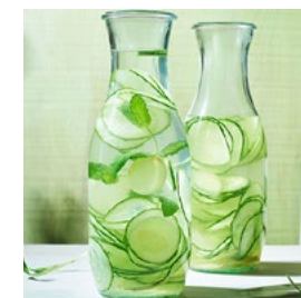
ASTUCE BOISSON DE LA SEMAINE