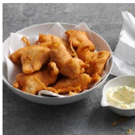
MARDI Beignets de truites