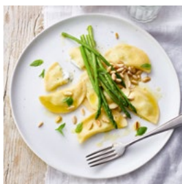
MARDI Raviolis au fromage frais aux fines herbes et asperges