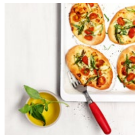
JEUDI Pizza asperges-tomates