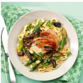
LUNDI Escalopes et sauce aux morilles