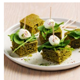
VENDREDI Focaccia aux épinards