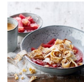
ASTUCE RHUBARBE DE LA SEMAINE Tagliatelle de crêpes et compote de rhubarbe**