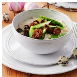
MERCREDI Risotto et ragoût asperges-morilles*