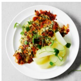
MARDI Filets de perche et mayonnaise à l'ail des ours