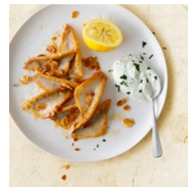
VENDREDI Sandre en croûte de persil et de Sbrinz