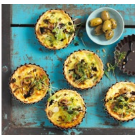
LUNDI Tartelettes au fromage frais