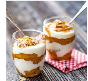
DESSERT-TIPP DER WOCHE Bratapfel-Crème