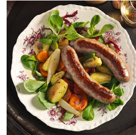
FREITAG Whisky-Dressing an Gemüsesalat mit Bratwurst