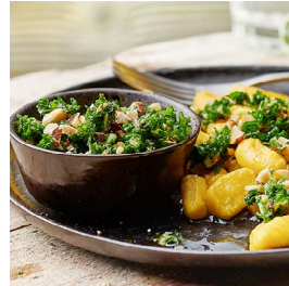
DONNERSTAG Safran-Gnocchi mit Federkohl-Pesto