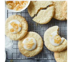
GUETZLI-TIPP DER WOCHE Zitronen-Ingwer- Cookies