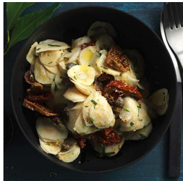
DIENSTAG Roher Pastinaken- salat an Zitronen- vinaigrette*