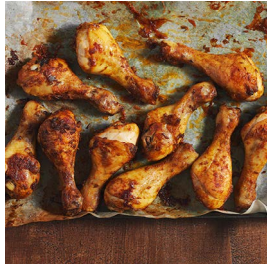
DIENSTAG Cajun-Drumsticks mit Kräutercreme