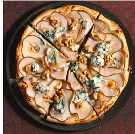
MITTWOCH Birnentarte mit Blauschimmelkäse