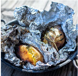
MONTAG Kartoffeln im Feuer