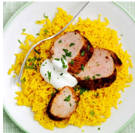
MITTWOCH Tandoori-Filet mit Kurkuma-Reis