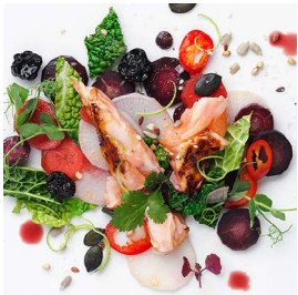
MONTAG Tataki mit Lachsforelle