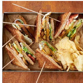
DONNERSTAG Vegi-Club- Sandwiches