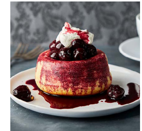
BACK-TIPP DER WOCHE Rosoli-Savarins