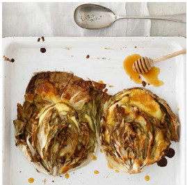
MONTAG Gefüllter Castelfranco