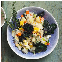
DIENSTAG Kalette-Gemüse- Reis-Pfanne