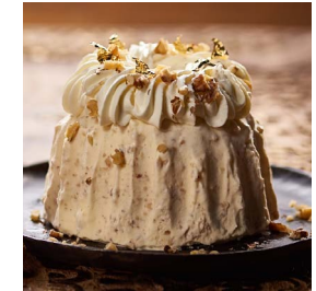
DESSERT-TIPP DER WOCHE Baumnuss-Parfait