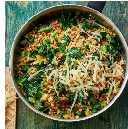
FREITAG Dinkelrisotto mit Winterspinat